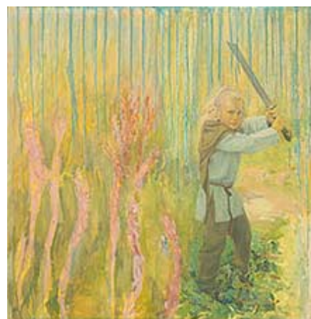
"Alven i skogen", 122x119 cm © Gert Aspelin