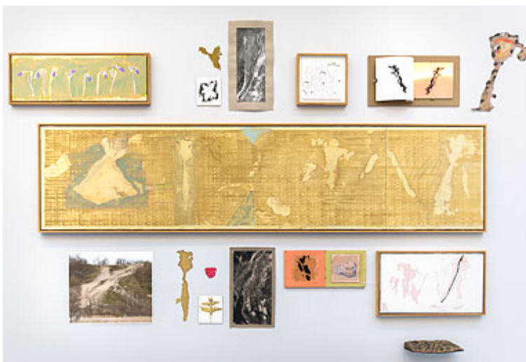
"Out of the Web" © Gert Aspelin

I sin utställning på Konstakademien utgår Gert Aspelin från en bäckravin i Kivik. Han tar ravinens fläckar och sandstråk till motiv, ljusa ytor som bryter igenom det mörkare gräset. Han använder också regnvattnets rännilar som förgrenar sig likt nät i sanden.