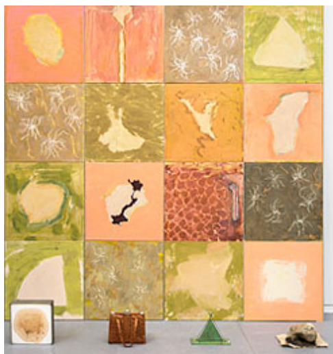
"16 kvadrater" © Gert Aspelin