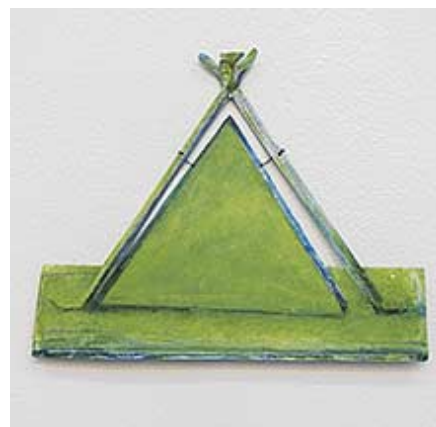
"Gong-Gong", 19x24 cm © Gert Aspelin

Gert Aspelin använder landskapets former för att utforska jaget som varit med om detta, en glimt av världen genom barnets blick och dess förkärlek för detaljer, ett barn som minns mammas handväska med sitt lås, minns en väg där solen vilat genom åren, gong-gongen som kallade till matbordet, farfars målningar och klossarnas torn intill vardagsrumsmattans mönster.